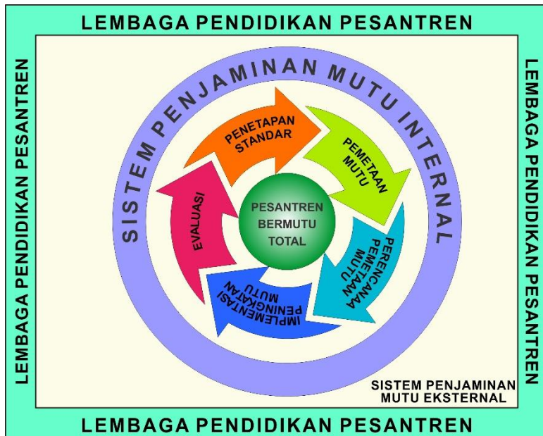
Gambar 3 Desain Mutu Pondok Pesantren Syamsul ‘Ulum

Adapun desain mutu Pesantren Syamsul ‘Ulum dideskripsikan sebagaimana gambar berikut: