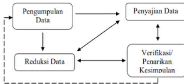
Gambar 1 Analisis Data Penelitian Model interaktif (Miles dan Huberman, 1992)

Berdasarkan gambar di atas, pengumpulan dan analisis data dilakukan secara berulang-ulang untuk menemukan desain mutu Pondok Pesantren Syamsul ‘Ulum. Dalam mereduksi data, semua data lapangan ditulis sekaligus dianalisis, direduksi, dirangkum, dipilih hal-hal yang pokok, difokuskan pada hal-hal yang penting, dicari tema dan polanya, sehingga tersusun secara sistematis dan lebih mudah dikendalikan. Data display dilakukan oleh peneliti agar data yang diperoleh dapat dikuasai dengan dipilah secara fisik dan dibuat dalam kertas dan bagan. Pembuatan display ini juga merupakan bagian dari analisis. Setelah data terkumpul, maka dianalisis dengan menggunakan metode deskriptif sehingga didapat desain mutu Pondok Pesantren Syamsul ‘Ulum yang sebenarnya.